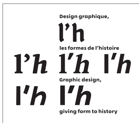
Visuel 01 Colloque «Design graphique, les formes de l'histoire». Conception du visuel: André Baldinger et Philippe Millot.

Les visuels ci-après peuvent être obtenus auprès des agences de presse citées en page 1. Ces images doivent être accompagnées de leur légende.