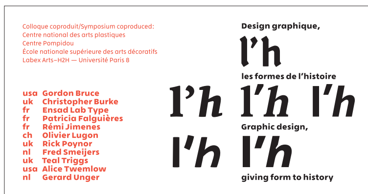
Visuel 03 Colloque «Design graphique, les formes de l'histoire». Conception du visuel: André Baldinger et Philippe Millot.